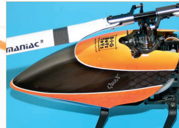
Der Testträger, ein X-Cell Furion. Die von Albert Fruth lackierte Haube wurde bei den ersten Flügen durch eine einfacher lackierte Haube ersetzt. Man kann ja nie wissen!

Der Hersteller gibt an, dass die Sensorik auf neuester MEMS-Technologie basiert. O.k. – was immer das auch heißt, mir sagt es leider nicht viel, aber Hauptsache es funktioniert. Das MICROBEAST lässt sich mit einem optionalen Adapterkabel auch nur als Heck-Gyro einsetzen. Bei dem Preis ist das meiner Meinung nach auch eine interessante Variante.