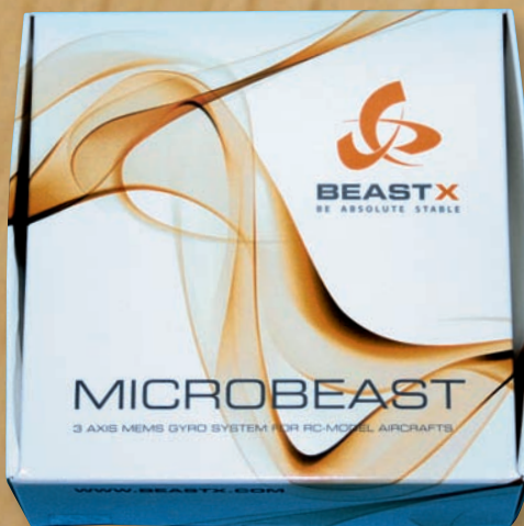
In dieser attraktiven Verpackung kommt das MICROBEAST zum Kunden.

Ein weiterer Punkt des Parametermenüs ist die »Taumelscheiben-Aufbaumkompensation«. Mit dieser soll natürlich nicht das Aufbäumen der Taumelscheibe, sondern das Aufbäumen des Hubschraubers im Schnellflug eingestellt werden. Als letzter Punkt kann der Heading-Lock-Anteil des Heckrotors eingestellt werden.