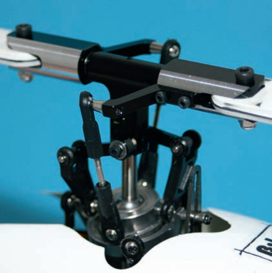
Der RXJ-Rotorkopf mit Anlenkungen. Die Mitnehmerhebel sind direkt am Zentralstück verschraubt.

dem Set bei. Die Software für Windows und Mac kann demnächst kostenlos auf der Homepage des Herstellers ( www.beastx.com ) heruntergeladen werden. Die Software zum Update ist bereits verfügbar. Als nächsten Schritt soll es eine Einstellsoftware geben, mit der spezielle Parameter, wie z. B. die Taumelscheibendrehung, eingestellt werden können. Eine Software, mit der die komplette Programmierung durchgeführt werden kann, ist ebenfalls in Vorbereitung, wird aber sicherlich noch ein halbes Jahr dauern.