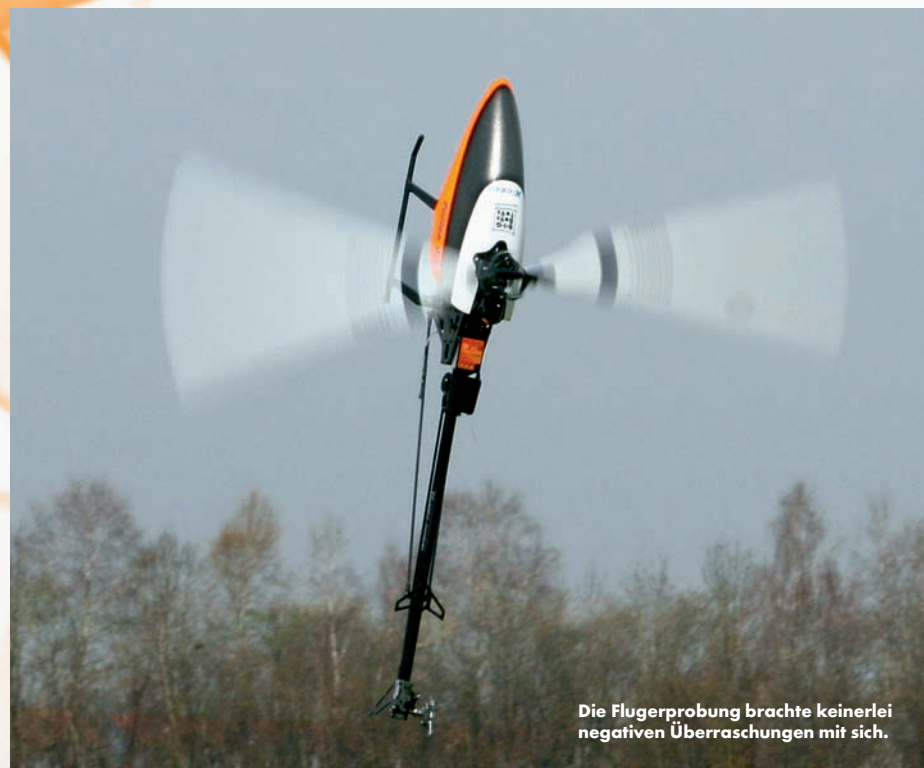
Die Flugerprobung brachte keinerlei negativen Überraschungen mit sich.

Updates und weitergehende Einstellmöglichkeiten (Setups) sollen bequem mit dem optionalen USB-Interface »USB2SYS« über die BEASTLINK-Schnittstelle durchgeführt werden können. Bei der ersten Serie liegt dieses Kabel